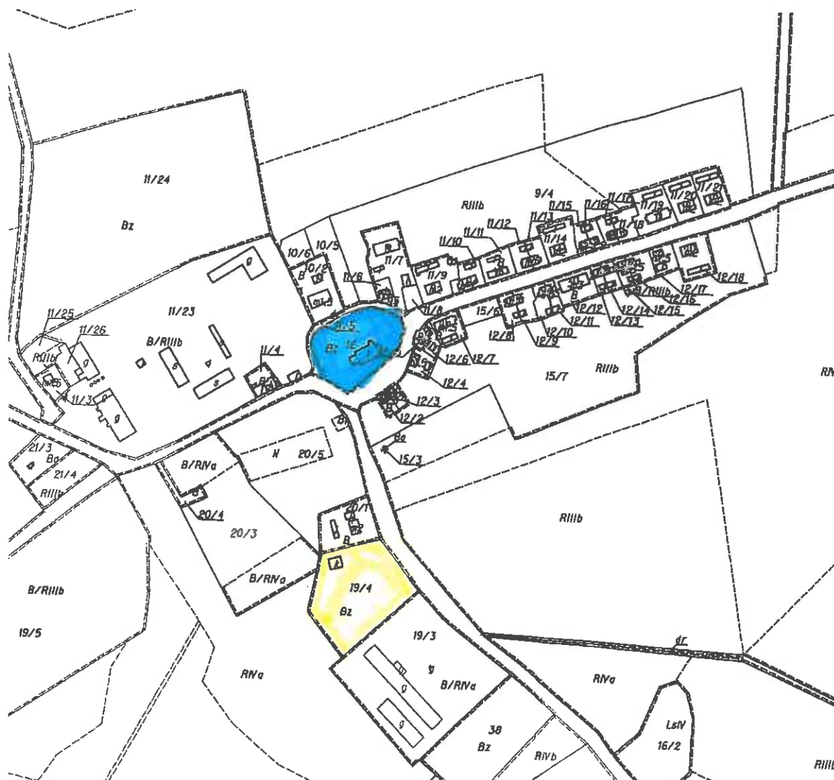
Mapa obrazująca obszary o szczególnym znaczeniu dla zaspokojenia potrzeb mieszkańców

obiektu świetlicy przy jednoczesnym zadbaniu o ochronę środowiska i pozyskanie odnawialnych źródeł energii do utrzymania tego obiektu.